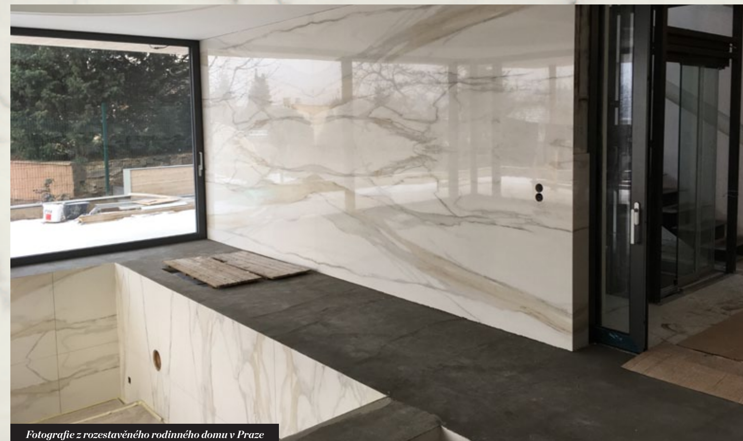
Fotografie z rozestavěného rodinného domu v Praze

v bazénu, kde probíhá dekor ze stěny na dno a následně opět na stěnu. Není výhodou jen nádherný design, jako kdyby byl bazén vytesán z bloků mramoru, ale především máte v bazénu minimum spár a díky tomu je velice jednouchá údržba.