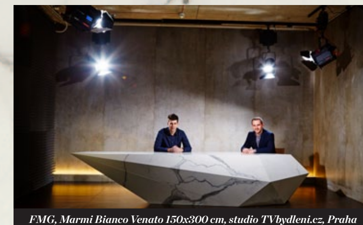
FMG, Marmí Bianco Venato 150x300 cm, studio TVbydlení.cz, Praha

Prodejci obkladů a dlažeb Vám naopak naloží materiál na vozík, v lepším případě přivezou na stavbu a tím to pro ně končí. U velkoformátových obkladů a dlažeb však musí být přístup jiný. Od pečlivého návrhu, který neřeší jen design, ale optimalizuje