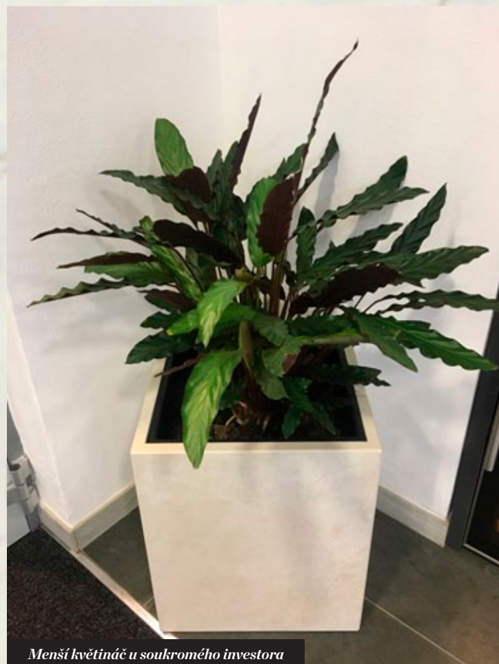
Menší květináč u soukromého investora

Velkoformátové dlažby přinesly další změny a to je změna struktury zákazníků – investorů a tím i typy projektů. Při realizaci luxusních rezidencí se často setkáváme s řešením nejmenších detailů, jak ze strany architekta, tak často i ze strany investora. Jejich požadavky na kvalitu zpracování se často utvářely na základě jejich zkušeností z nejlepších hotelů, nebo rezidencí jejich přátel. Tím začaly vznikat i různé otázky architektů na možnost práce s tímto materiálem jinak, než jak jsme byli zvyklí pracovat s dlažbou. Díky těmto požadavkům jsme realizovali obklady výtahů v designu onyxu, kde vždy jedna stěna byla z jednoho kusu se zapuštěnými tlačítky, LED podsvícením, apod.