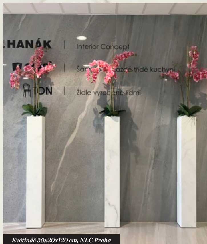
Květináč 30x30x120 cm, NLC Praha