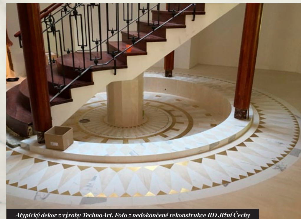
Atypický dekor z výroby TechnoArt. Foto z nedokončené rekonstrukce RD Jižní Čechy

Velkoformátové dlažby jsou v současnosti nejmodernější technologií, která je v tomto oboru využívána. Neznamena to však, že je nutné použít jen pro moderní stavby. Předloha pro tyto materiály je ve většině případů přírodní mramor nebo žula, které se v architektuře používají tisíce let. Proto je daný materiál možné použít i při rekonstrukci secesní vily, apod. Díky výrobnímu závodu TechnoArt Vám z daných materiálů dokážeme vyrobit i repliky mozaik, nebo dekor dle vlastního návrhu.