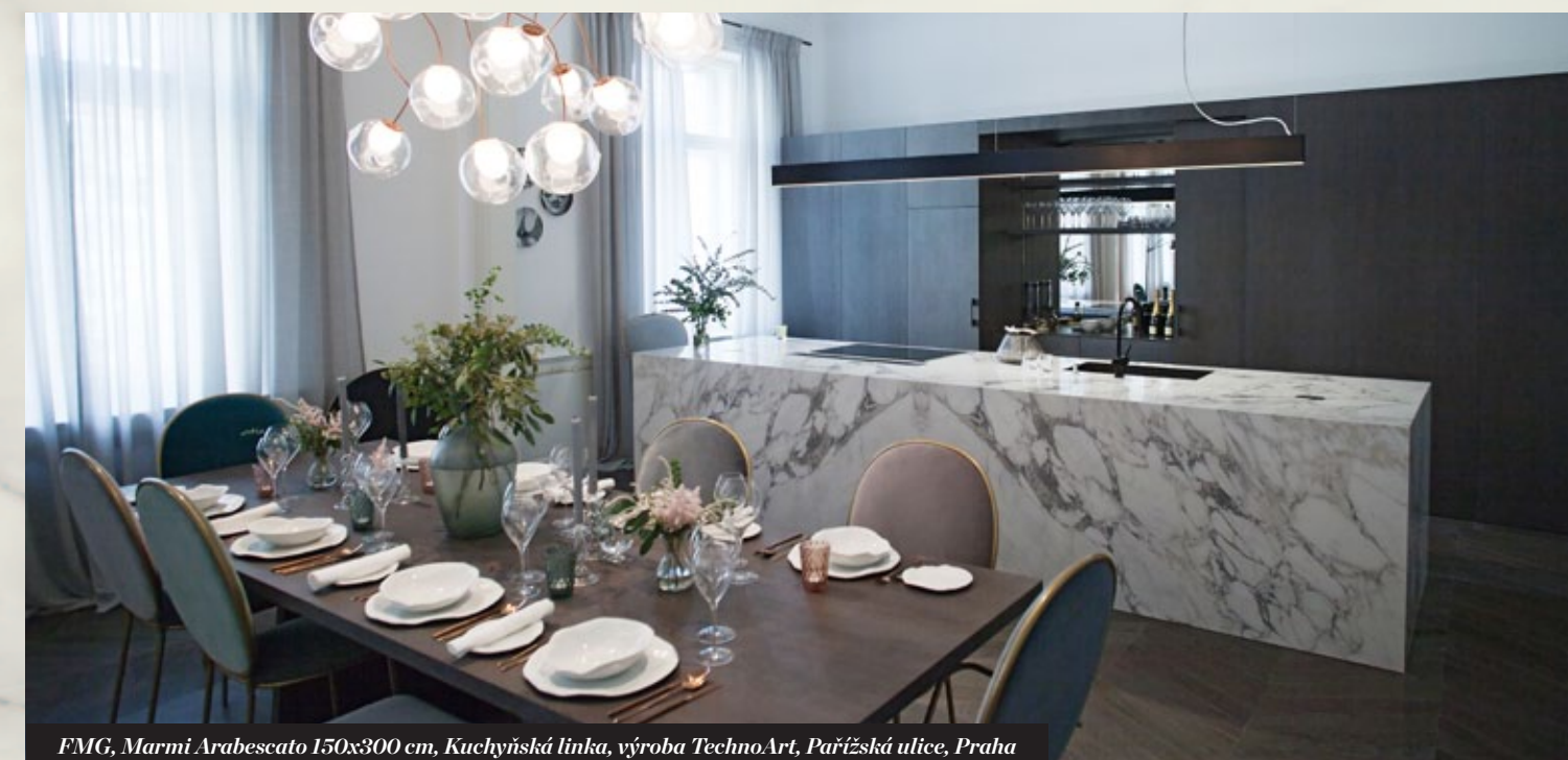
FMG, Marmí Arabescato 150x300 cm, Kuchyňská linka, výroba TechnoArt, Pařížská ulice, Praha

ProCeram velkoformátové dlažby prodává již 3 roky celkové množství přesáhlo více než 50.000 m 2 . Se zakázkami na počátku vznikalo mnoho problémů, které pro nás byly velkou školou a dnes přesně víme, jak s tímto materiálem pracovat, až po jeho finální pokládku. Díky výrobnímu záводу TechnoArt, kam jsme museli dokoupit mnoho strojů, dnes pracujeme s velkoformátovou deskou stejně jako kameníci. Příkladem může být moderátorský pult televizního studia TV Bydlení – www.tvbydleni.cz , nebo kuchyňská linka s navazující kresbou soukromého investora v Pařížské ulici v Praze.