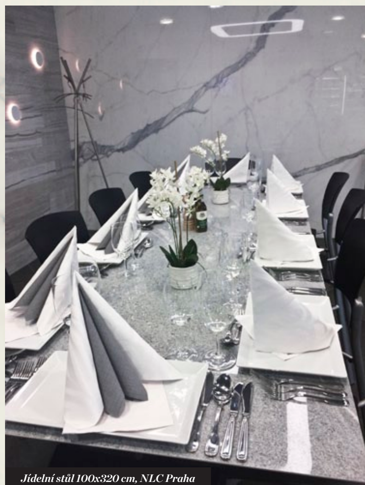
Jídelní stůl 100x320 cm, NLC Praha

Rozvíjející se zájem o květináče ze stejného materiálu jako je dlažba nebo naopak z kontrastního, který má plnohodnotnou výbavu samo zavlažovacího květináče, byl odstartován vystavením prvních vzorků v New Living Center v Praze. V tomto případě je výhodou nejen design, ale i možnost volby velikosti, které velkoformátová dlažba umožňuje. Je tedy možné vytvářet i velké externí květináče na terasy administrativních budov, které jsou nejen krásné, ale především bezúdržbové.